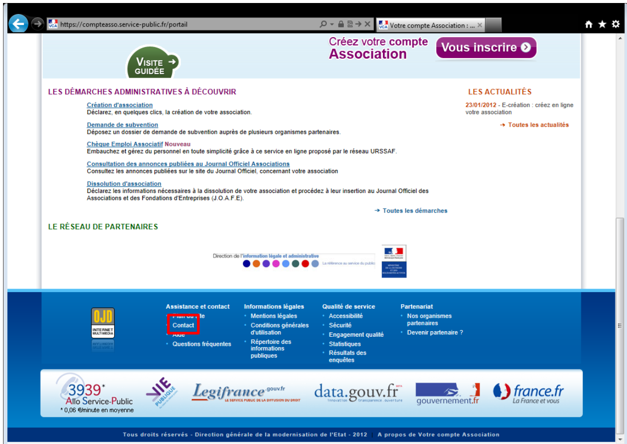
Lien « Contact » dans le pied de page du portail VCA.

Le pied de page du portail VCA permet un accès rapide au support via le lien « contact ».